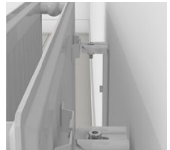
erhältlich für Montage über die obere Schweißnaht oder für Befestigungslaschen