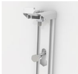
leichte Montage mit Höhenjustierung